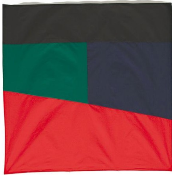
Zinny - Maidagan. Thirteen Studies of Horizon's Line, 2013. Tela. 150 x 150 cm

Moción, de Zinny & Maidagan, se puede visitar en Galería Henrique Faría, Libertad 1630. Hasta el 3 de octubre